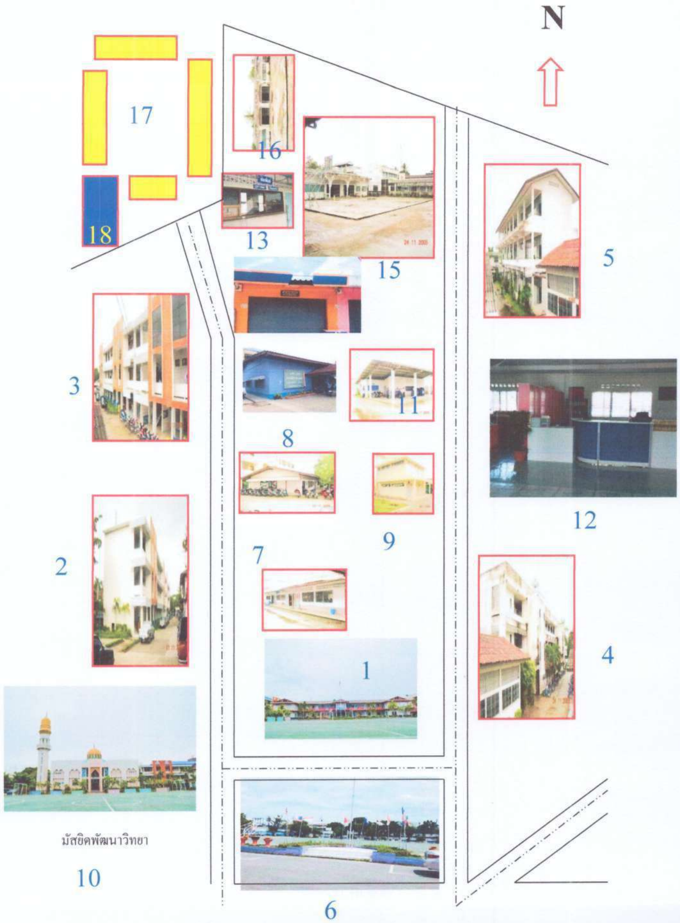
มัสยิดพัฒนาวิทยา